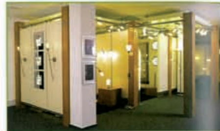
△ Woffl präsentierte ein gewohnt umfangreiches Programm von Leuchten, unter anderem ein starkes Programm zum Thema Energiesparen.

Die zweite Veranstaltung ist schwieriger als die erste, sagt man meistens: Der erste Schwung des Neuen ist etwas abgeebbt, und auch die Besucher müssen erneut motiviert werden. Die Lichtwoche Sauerland, die im März die zweite Veranstaltung abhielt, hat diese Klippe gekonnt umschiffen und erneut für eine gute Information des Marktes für Leuchten gesorgt.